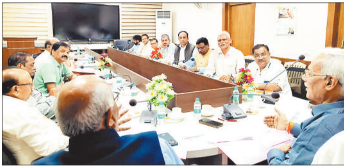
बैठक में उपस्थित संघ के पदाधिकारी एवं अधिकारी।

भारतीय मजदूर संघ से संबद्ध छत्तीसगढ़ बिजली कर्मचारी संघ-महासंघ के पदाधिकारियों की विद्युत कंपनी के तीनों प्रबंधक निदेशक के साथ आयोजित बैठक