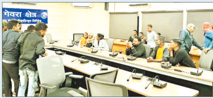
कोरबा क्षेत्र में आयोजित त्रिपक्षीय बैठक का दृश्य।