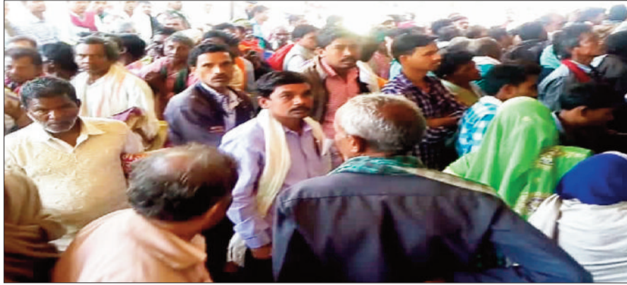
जिला सहकारी बैंक में राशि पाने पहुंचे किसान।

धान बेचने के बाद जिले के किसान अपनी ही जमा राशि पानी के लिए जिला सहकारी बैंकों में काफी मशक्कत कर रहे हैं। वही 25 हजार रुपए की लिमिट ने कृषकों की दिक्कतें और भी बढ़ा दी है जिसके चलते किसान परेशान हैं। गौरतलब है कि जांजगीर चांपा जिले के पांच ब्लॉक को मिलकर दर्जन भर जिला सहकारी बैंकों का संचालन किया जा रहा है। जिला सहकारी बैंक प्रमुख रूप से जांजगीर अकलतरा बलौदा नवागढ़ पामगढ़ सारागांव सहित अन्य जगहों पर संचालित किया जा रहा है ताकि किसान धान बेचने के बाद संबंधित सहकारी बैंक से अपनी जमा राशि पा सके वहीं दूसरी ओर जिला सहकारी बैंकों में इस समय कृषकों की भारी भीड़ नजर आ रही है किसान अपनी जमा राशि लेने के लिए सुबह से ही बैंकों में नजर आ रहे हैं इस तरह की समस्या सभी जिला सहकारी बैंकों में नजर आ रही है वही 25 हजार रुपए की लिमिट ने कृषकों की दिक्कतें और भी बढ़ा दी है इस समय फरवरी के महीने में कई जगहों पर किसान अपने बेटे एवं बेटियों की शादी भी कर रहे हैं लेकिन बैंक से समय पर राशि नहीं मिल पाने के चलते कृषक परेशान हैं। जिले के सहकारी बैंकों