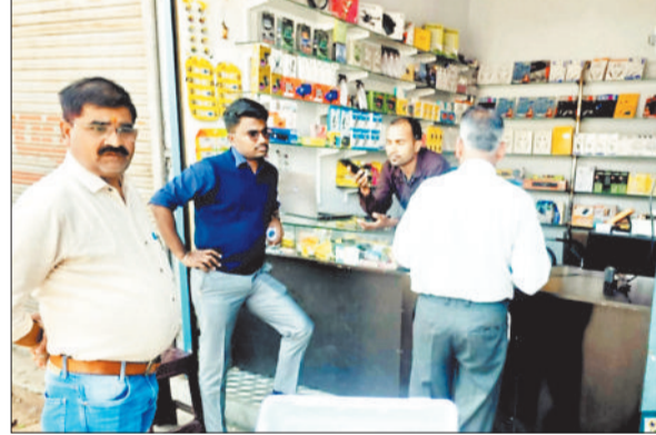
जांच करते अधिकारी।

प्रशासन एव राजस्व की टीम ने सख्त रुख अपनाते हुए व्यापक अभियान चलाया मुख्य नगर पालिका अधिकारी ने स्वयं नगर के प्रमुख बाजार क्षेत्रों एवं वाडों का भ्रमण कर नागरिकों व व्यापारियों से कर जमा करने की अपील की। निरीक्षण के दौरान अधिकारियों ने दुकानदारों एवं संपत्ति स्वामियों से सीधे संवाद कर बकाया करों की जानकारी दी तथा शीघ्र भुगतान करने के