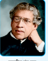
जगदीश चंद्र बसु

रेडियो के विकास में भारत का योगदान: वेसे तो पहला व्यावहारिक रेडियो 1895 में गुग्लिएल्मो मार्कोनी द्वारा बनाया गया था, लेकिन भारतीय वैज्ञानिक जगदीश चंद्र बसु ने 1895 में बिना तार के सिग्नल भेजने का प्रदर्शन कर दिया था। भारत में पहला रेडियो प्रसारण जून 1923 में बॉम्बे रेडियो क्लब द्वारा किया गया था। अपने देश का ऑल इंडिया रेडियो 99 प्रतिशत जनसंख्या तक पहुंच के साथ दुनिया के सबसे बड़े प्रसारकों में से एक है।