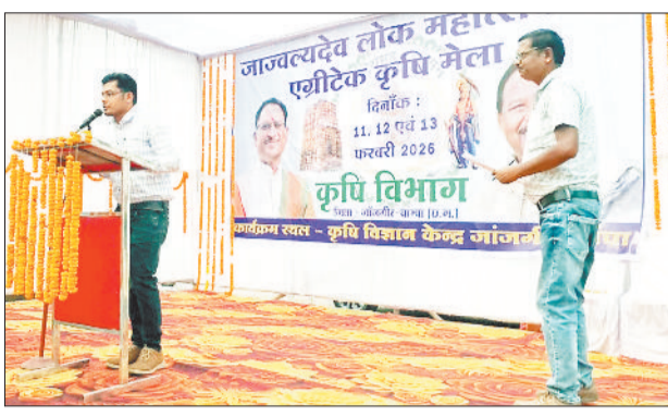
कृषक संगोष्ठी में उपस्थित किसानों को जानकारी देते कृषि वैज्ञानिक।

जाज्वलदेव लोक महोत्सव एवं एग्रीटेक कृषि मेला का आयोजन 11 से 13 फरवरी तक जिले के हाईस्कूल मैदान जांजगीर एवं कृषि विज्ञान केन्द्र जर्वे जांजगीर में आयोजित किया जा रहा है। गुरुवार 12 फरवरी को कृषि विज्ञान केन्द्र जर्वे जांजगीर में आयोजित कृषक संगोष्ठी कार्यक्रम में मत्स्य पालन, प्राकृतिक खेती एवं रबी फसलों के वैज्ञानिक प्रबंधन पर विशेषज्ञों ने मार्गदर्शन दिया गया।