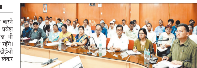
बैठक में शामिल डीईओ समेत अन्य अफसर।

बोर्ड परीक्षा के दौरान केन्द्र में ड्यूटी करने वाले पर्यवेक्षक भी मोबाइल लेकर प्रवेश नहीं कर सकेंगे। साथ ही केन्द्राध्यक्ष भी मोबाइल लेकर प्रवेश से उपस्थित रहेंगे। बोर्ड परीक्षा को लेकर कलेक्टर ने डीईओ समेत आला अधिकारियों की बैठक लेकर निर्देश जारी किए।