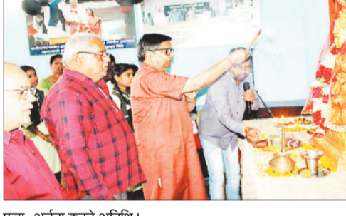
पूजा-अर्चना करते अतिथि।

अकलतरा एजुकेशन ट्रस्ट द्वारा संचालित राजेंद्र कुमार सिंह उच्चतर माध्यमिक विद्यालय, अकलतरा में कक्षा 12वीं के विद्यार्थियों के लिए आशीर्वाद एवं विदाई समारोह का आयोजन