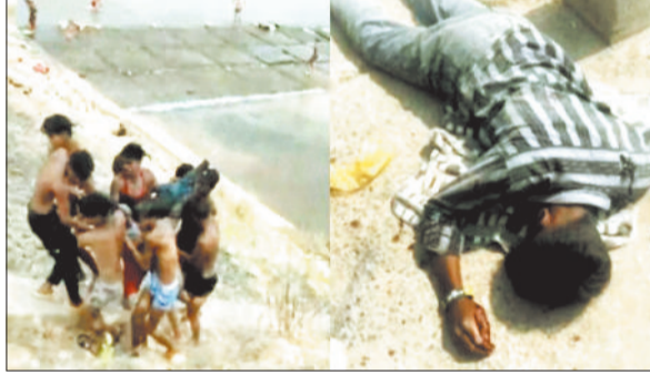
हादसे के बाद सड़क पर पड़ा युवक का शव।