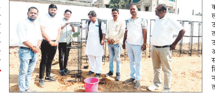
पौधरोपण कर जागरूकता का संदेश देते जनप्रतिनिधि, अधिकारी, समाजसेवी व नागरिक।

नगर पंचायत बम्हनीडीह में पर्यावरण संरक्षण और स्वच्छता को बढ़ावा देने के उद्देश्य से सिदार घाट मुक्तिधाम परिसर में पौधरोपण कार्यक्रम आयोजित किया गया। साथ ही स्वच्छ भारत मिशन के अंतर्गत नगर के विभिन्न वार्डों में हरा