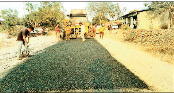
वत रहा सड़क निर्माण कार्य।